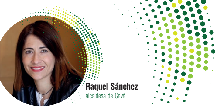
Raquel Sánchez alcaldesa de Gavà

Cada vez más, y cada vez con más necesidad y urgencia, el futuro de las ciudades pasa, por supuesto, por su capacidad de competir. Pero también, y con igual o mayor evidencia, por hacerlo en base a valores sólidos y a compromisos firmes, y si algún concepto resume ambas prioridades es el de la sostenibilidad. Sostenibilidad económica coherente con la sostenibilidad urbana y territorial.